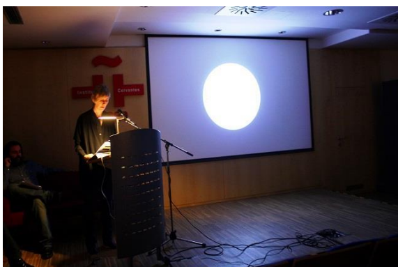
přednáška GPY Architects (Španělsko) Instituto Cervantes