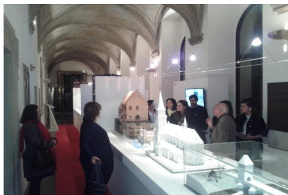
Noční komentovaná prohlídka výstav, Jiřský klášter, Pražský hrad