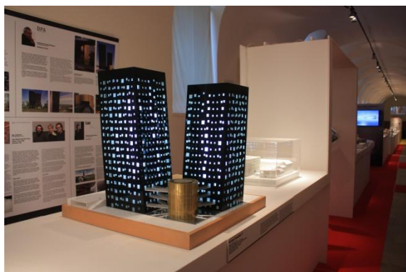
výstava Arch World, současná světová architektura