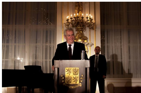
prezident Miloš Zeman, úvodní řeč Španělský sál, Pražský hrad