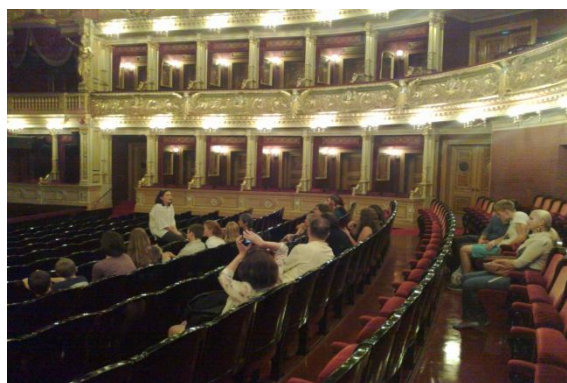
prohlídka historické budovy Národního divadla