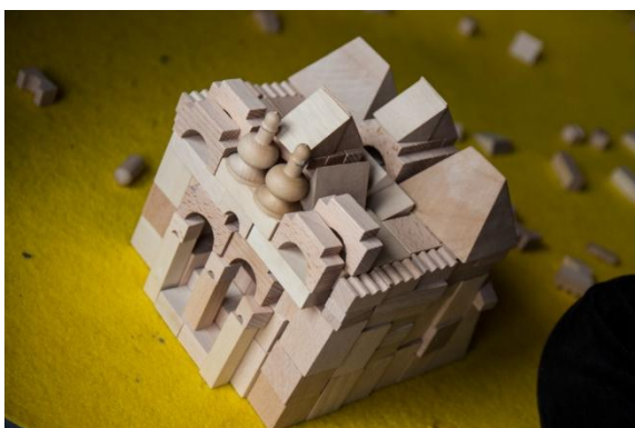
dílny, práce dětí – palác