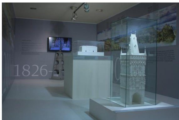
výstava Praha srdce Evropy