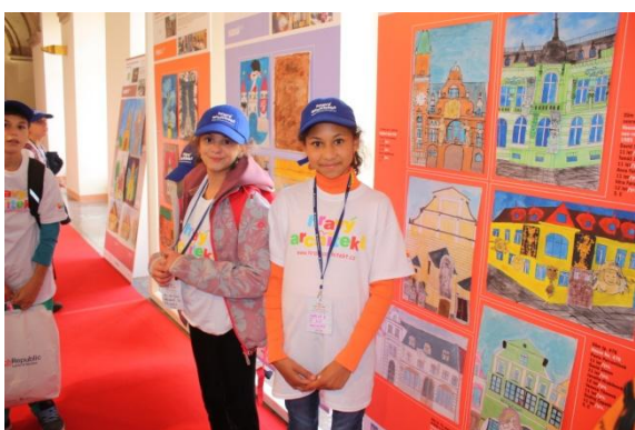
děti v expozici výstavy Hravý architekt