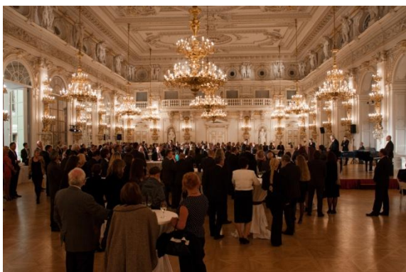
zahájení slavnostního večera, Španělský sál