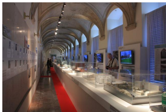
výstava Architektura v prostoru a čase, expoziční Moderní architektura