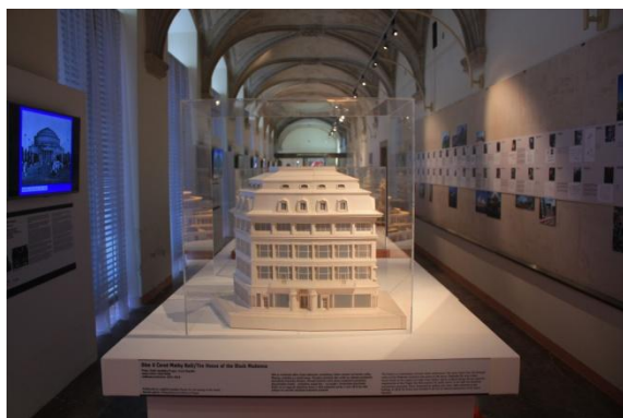
výstava Architektura v prostoru a čase, expoziční Moderní architektura