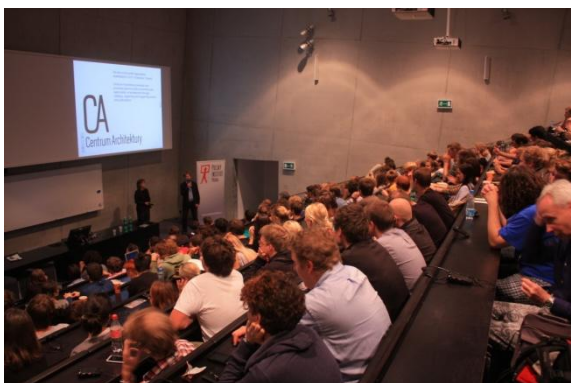
Česko-polský přednáškový půlmaratón Fakulta architektury ČVUT