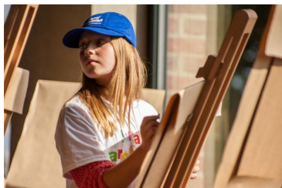
dílny - kreslení