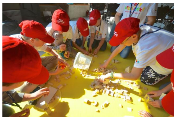
dílny – stavba ideálního města