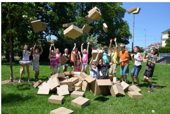
edukační činnost v Českých Budějovicích