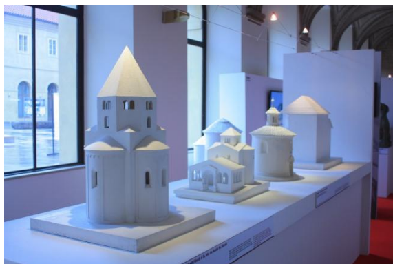
výstava Architektura v prostoru a čase, expoziční Románská architektura