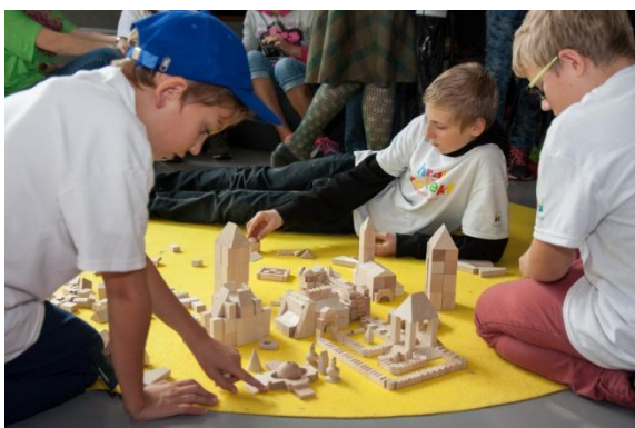
dílny – stavba ideálního města