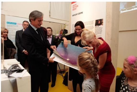
křest kalendáře Jan Kaplický – Interiéry Jiřský klášter, Pražský hrad