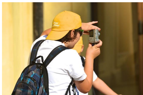
prohlídka Pražského hradu