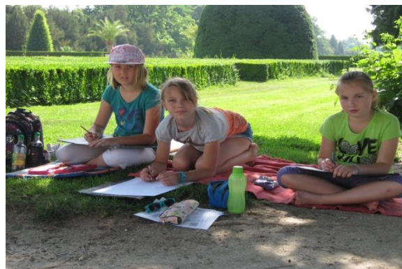
kresba obrázků pro výstavu, děti z Českých Budějovic