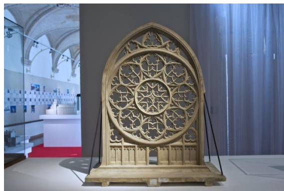
výstava Architektura v prostoru a čase, expoziční Eklektismus a secese