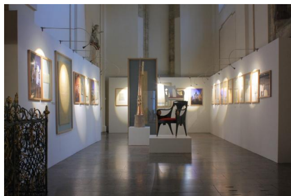
výstava Josip Plečnik: Skici