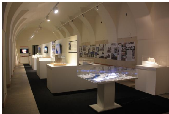
výstava Arch Works, současná česká architektura