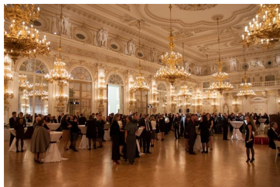
slavnostní večer, Španělský sál, Pražský hrad