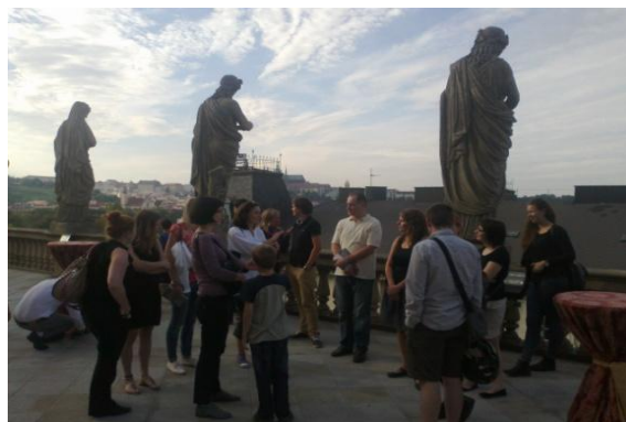
prohlídka historické budovy Národního divadla