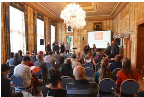
odborná konference Současná architektura v historických souvislostech